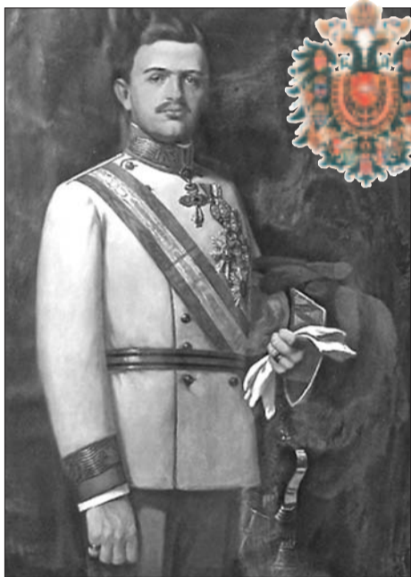
Comandante Supremo Imperatore Carlo I d'Asburgo. Beatificato dal Papa a Piazza S. Pietro il 03/10/2004.

Visita guidata ad alcune opere di ingegneria militare realizzate dall'esercito austro-ungarico, Comando supremo Imperatore Carlo I d'Asburgo ai fronti, Gen. Arciduca Giuseppe d'Asburgo e Gen. Borojevič, a partire dal 10 novembre 1917 dal Piave e sulle colline di Collalto. Visita particolare ai siti storici della zona.